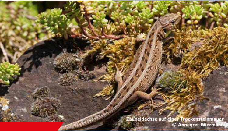
Zäuneidechse auf einer Trockensteinmauer

Jochen Krippenstapel Landkreis Ludwigslust-Parchim Tel. 03871/722-6800 jochen.krippenstapel@kreis-lup.de